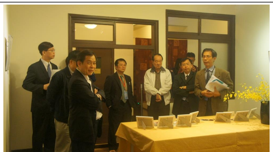
說明：委員訪視志生紀念館-觀看展覽作品-2