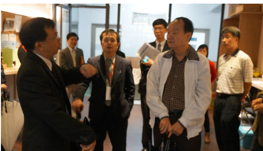
說明：委員訪視「同·CIO」創客空間-校長與委員互動