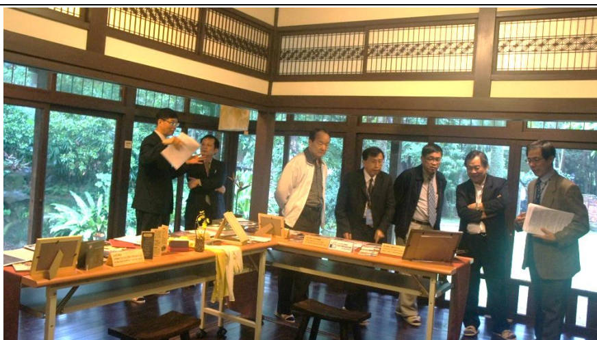
說明：委員訪視志生紀念館-觀看展覽作品