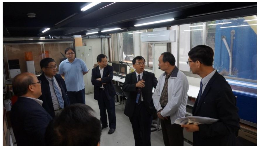
說明：委員訪視 Maker Space-場域之介紹